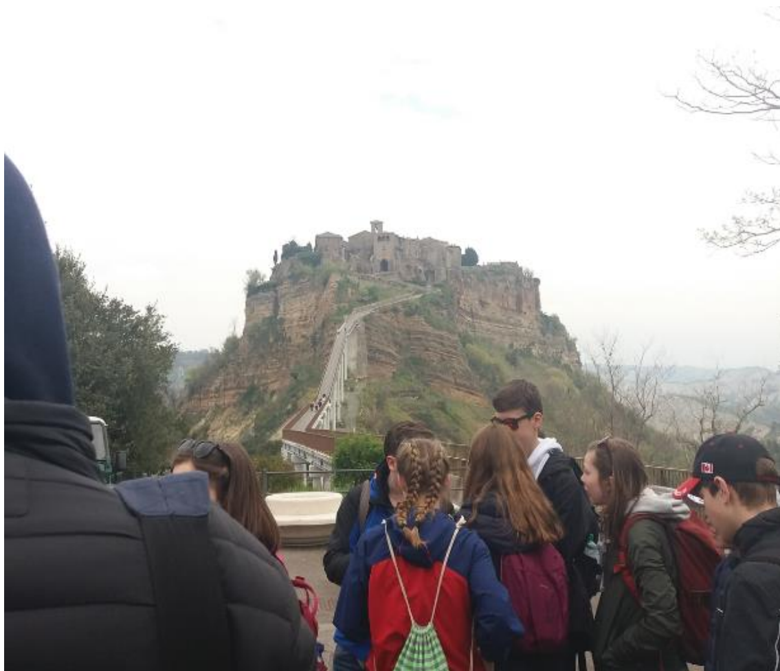
Montefiascone výlet na náhornú plošinu Bagnoregio