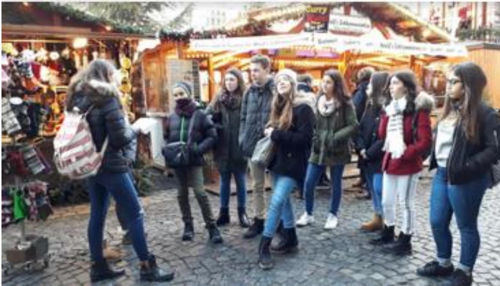
Hildesheim vianočné trhy