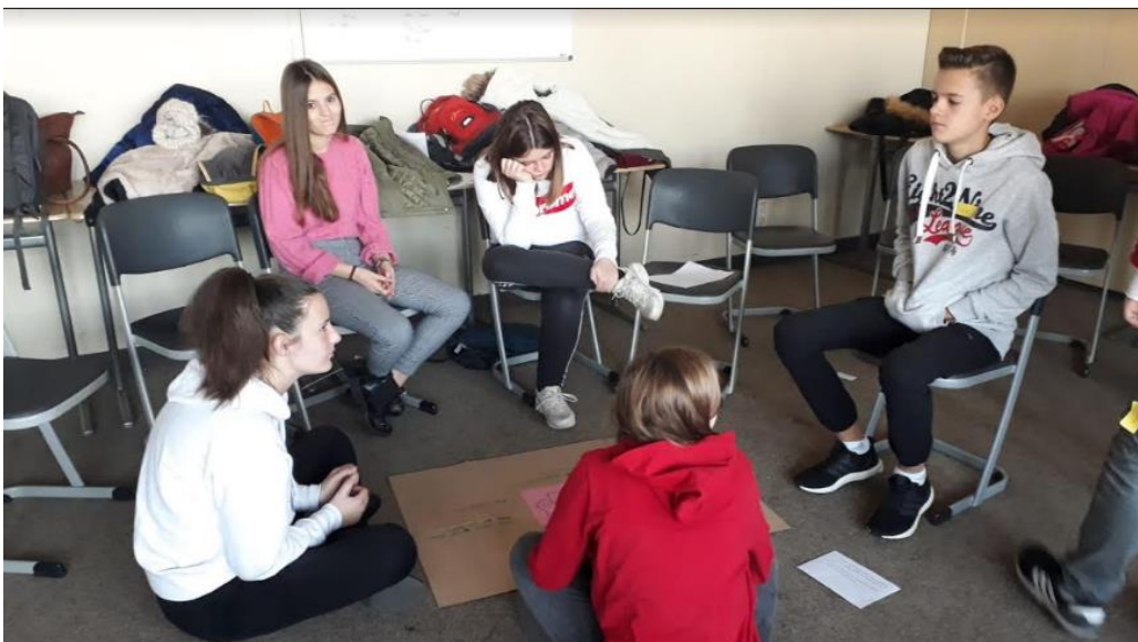
Montefiascone workshop (Apríl 2019)