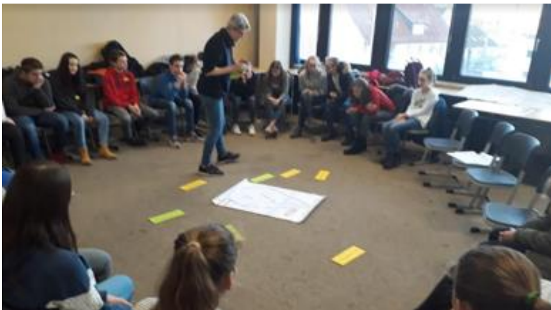
Hildesheim workshop (December 2018)